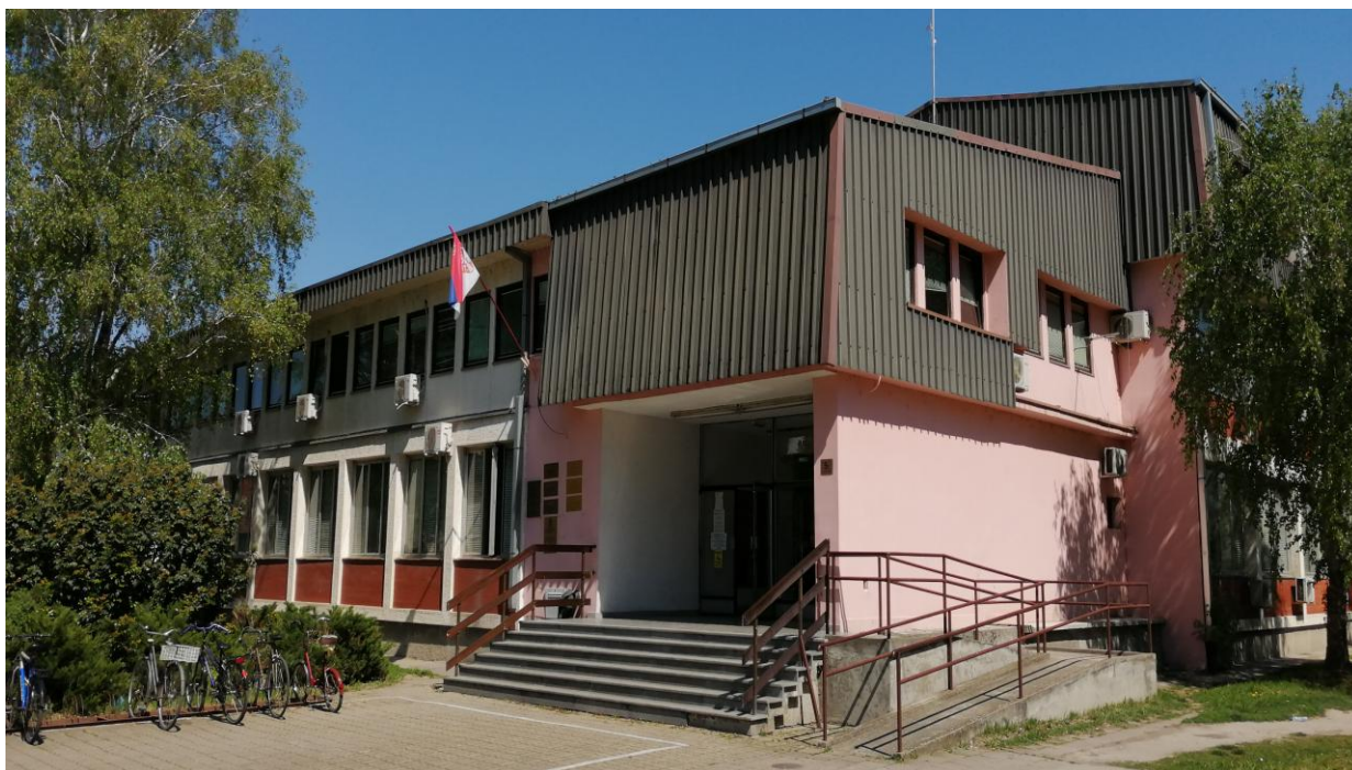
слика 1 - Зграда правосудних органа у Врбасу у којој се налази Основни суд у Врбасу